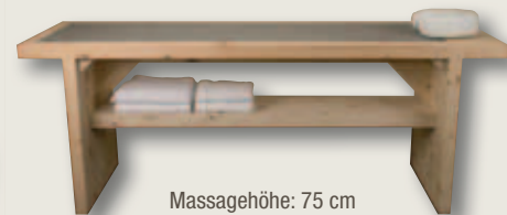
Massagehöhe: 75 cm